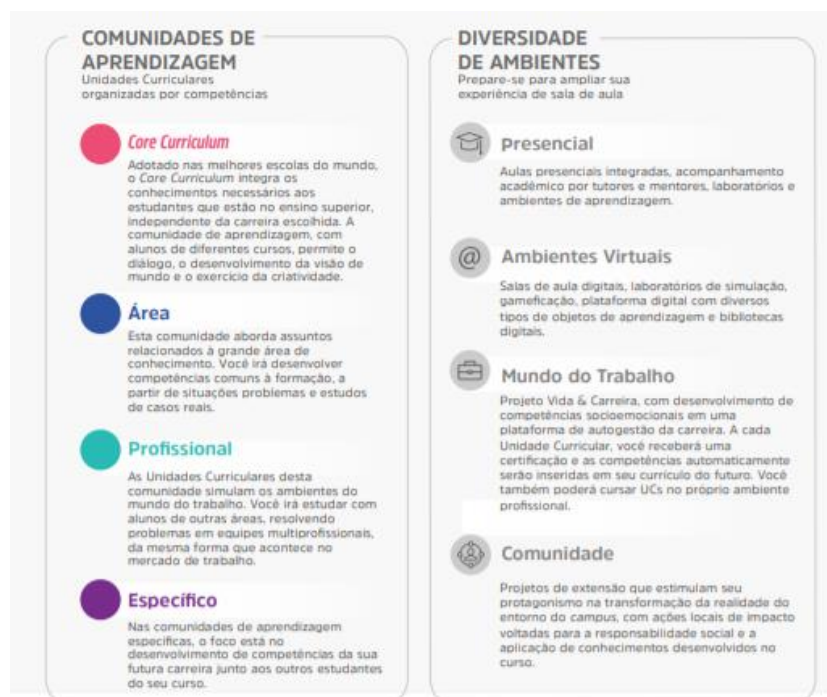
Figura 1 – Comunidades de aprendizagem e diversidade de ambientes

A flexibilidade do Currículo Integrado por Competências permite ao estudante transitar por diferentes comunidades de aprendizagem alinhadas aos seus respectivos eixos de formação. O percurso formativo é flexível, fluído, e ao final de cada unidade curricular o aluno atinge as competências de acordo com as metas de compreensão estudadas e vivenciadas ao longo do semestre.