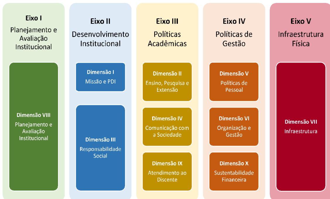
Figura 2 – Eixos e dimensões do SINAES

Essa autoavaliação, realizada em todos os cursos da IES, a cada semestre, de forma quantitativa e qualitativa, atenderá à Lei do Sistema Nacional de Avaliação da Educação Superior (SINAES), nº 10.8601, de 14 de abril de 2004. A legislação irá prever a avaliação de dez dimensões, agrupadas em 5 eixos, conforme ilustra a figura a seguir.